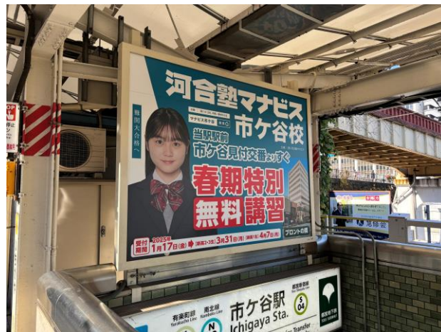
【2025年1月9日撮影】 現地お写真 (日中)