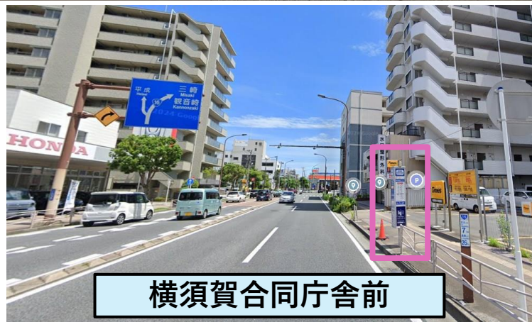
横須賀合同庁舎前