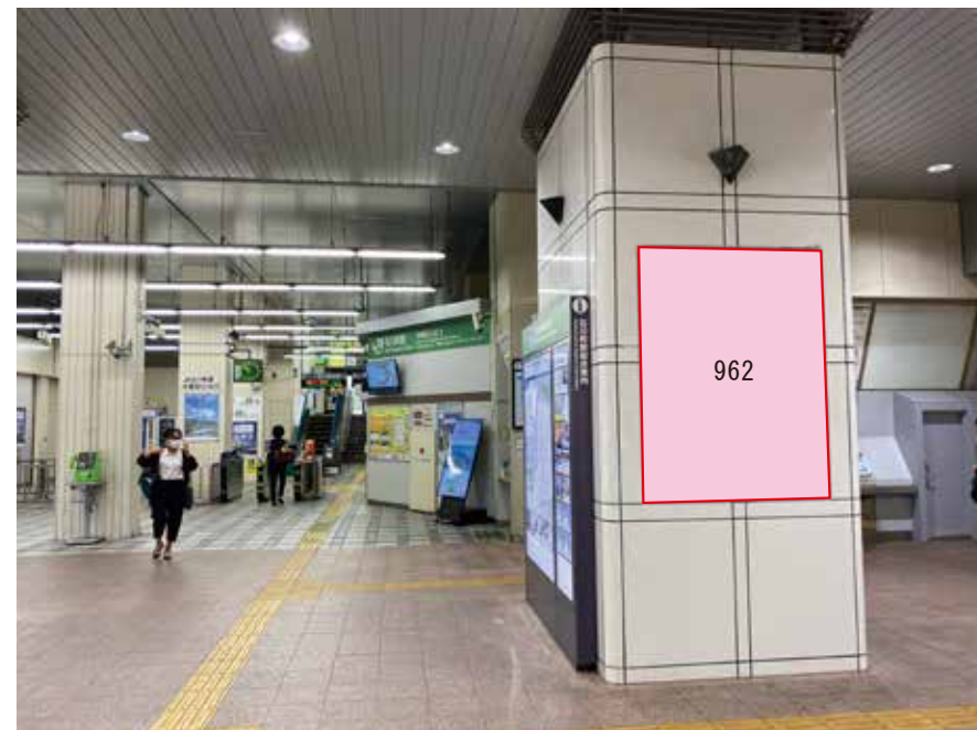
壁面に直接シート貼り。枠なし。